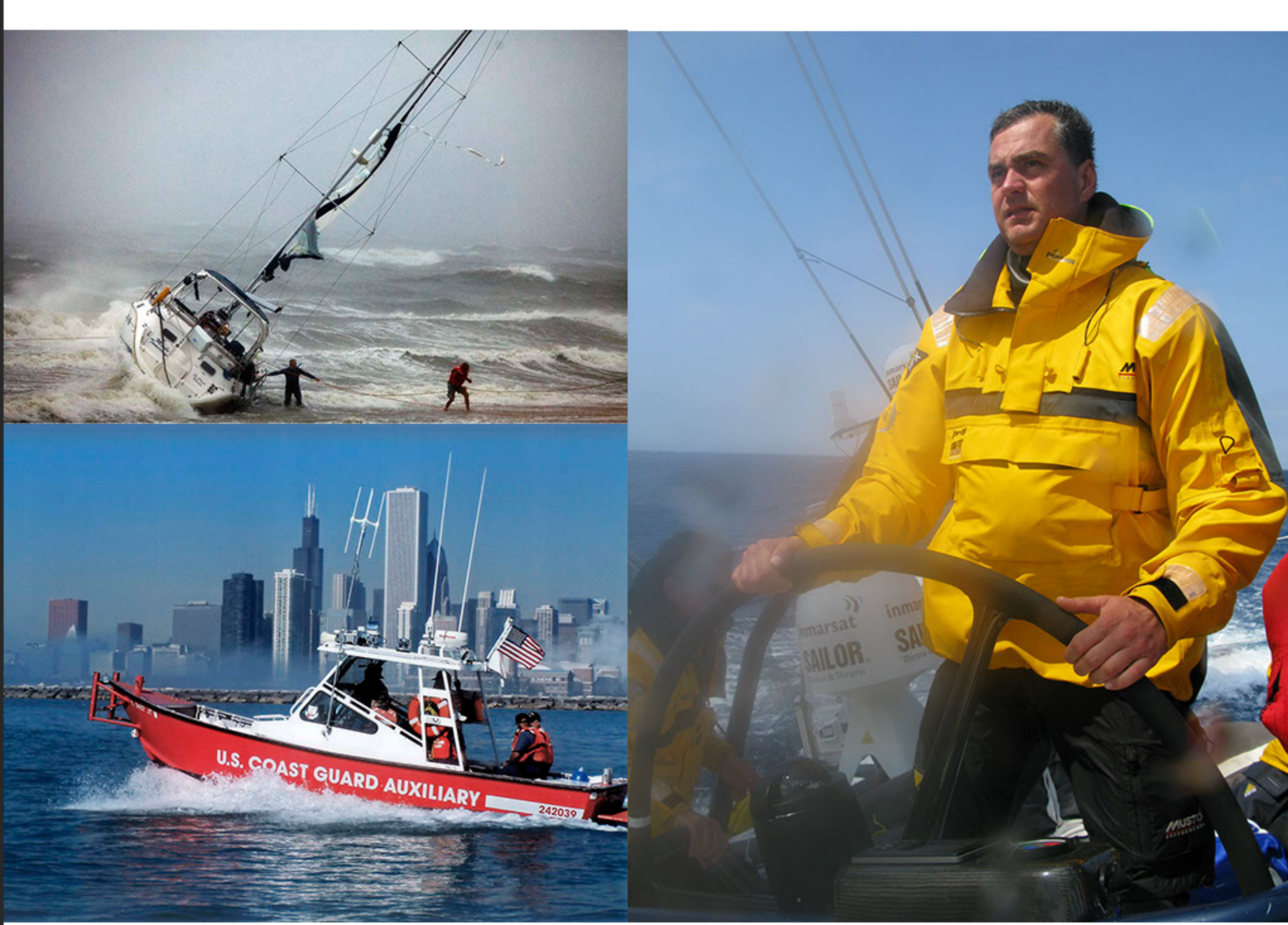
Schöchl, F. Die Haftung des Skippers, seine Rechte / seine Pflichten: Spezielle Risiken der Freizeitschiffahrt. 2009.

Stačí vyplout bez kvalitních map z oblasti plavby nebo s nefunkčními čerpadly na odsávání vody z podpalubi, opustit bezpečné kotviště za mlhy nebo za podmínek, na které není jachta ani posádka připravena. A nezapomínejme, že skipper nese odpovědnost za připravenost jachty k bezpečné plavbě a pokud si například při nalodění neprověří dobu použitelnosti nouzové pyrotechniky a záchranných prostředků, po převzetí jachty už za jejich stav odpovídá právě skipper. Není to dobrá vizička provozovatele a přinese mu to problémy, ale odpovědnost už nese skipper. A jestliže taková řada drobných chyb povede k havárii, už minule jsme upozorňovali, že skipper ručí neomezeně celým svým majetkem. Pokud nemáte pojištění odpovědnosti, zvažte, jestli se nevyplati ho uzavřít.